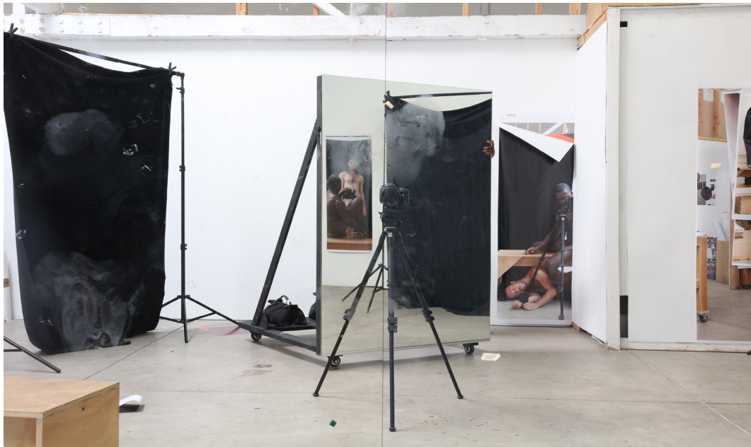
Abbildung 3: Paul Mpagi Sepuya, Studio (0X5A5038), 2020 Tintenstrahldruck, 50 × 75 in. (127 × 190,50 cm)