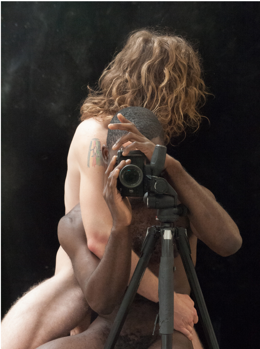
Abbildung 1: Paul Mpagi Sepuya, Darkroom Mirror (_2180520), 2018 Tintenstrahl Druck, 32,0 × 24,0 in. (81,28 × 60,96 cm)