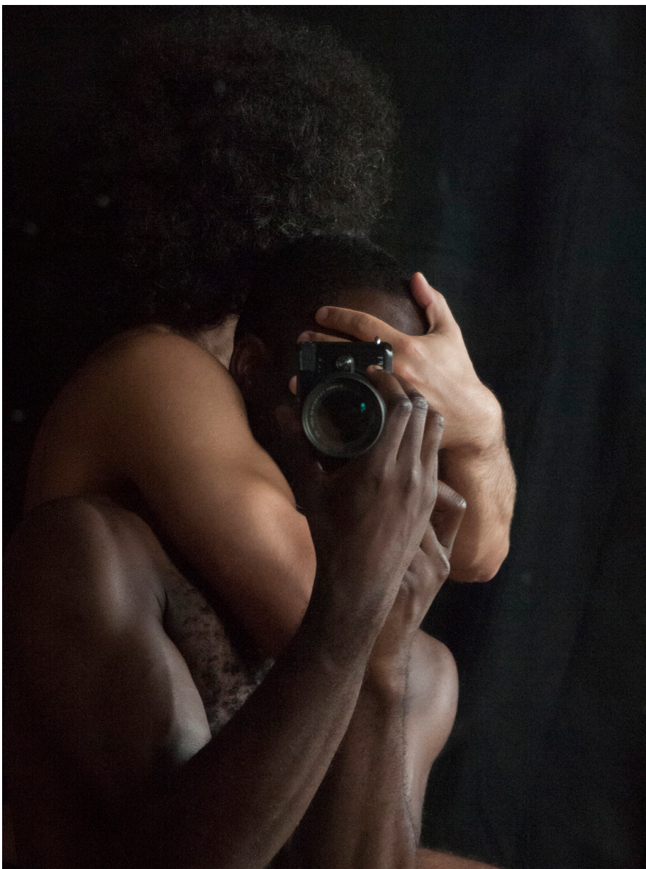
Abbildung 4: Paul Mpagi Sepuya, Darkroom Mirror (_2070386), 2017 Tintenstrahl Druck, 32 × 24 in. (81,28 × 60,96 cm)